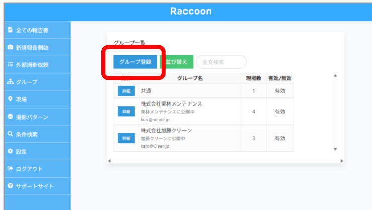
① グループ>グループ登録を選択