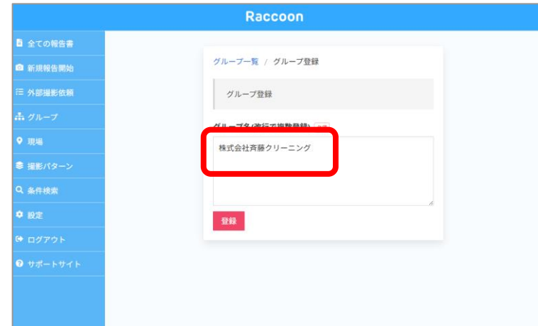
② グループ名を記入