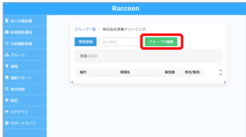
④ グループの編集を選択