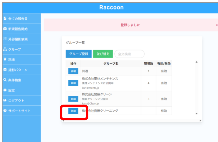
③ 該当するグループの詳細を選択